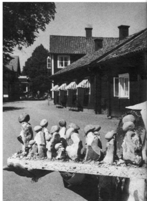
Artkelförfattaren 1973 med sitt verk Grötlunken